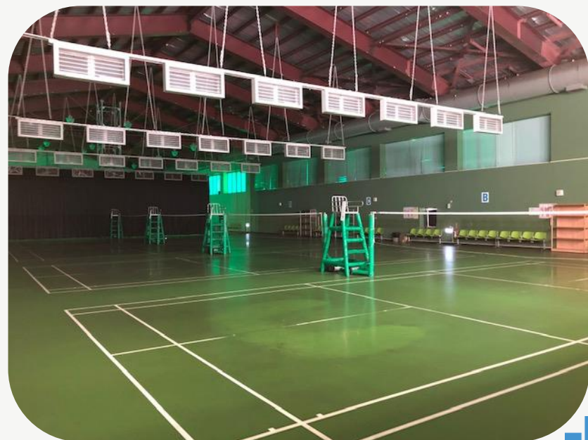
羽球場 排球場 籃球場